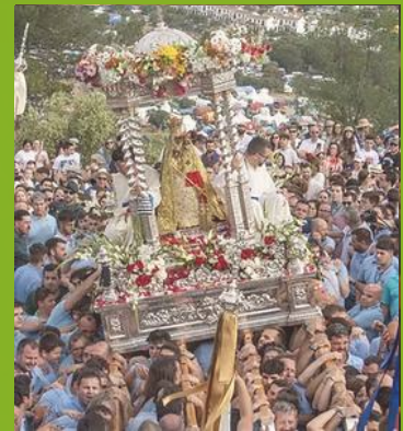
Virgen de la Cabeza

Centro histórico declarado de interés cultural