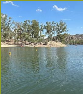
Sierra de Andújar bandera azul en playa de interior