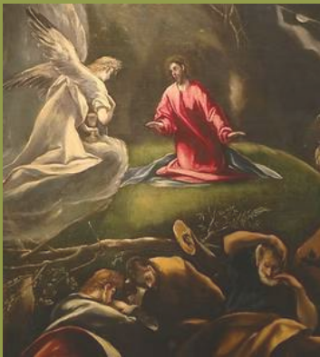
La Oración del Huerto El Greco